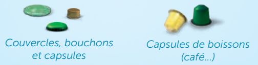
Couvercles, bouchons et capsules