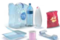
Emballages en plastique