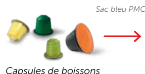
Sac bleu PMC Capsules de boissons