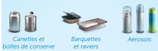
Canettes et boîtes de conserve