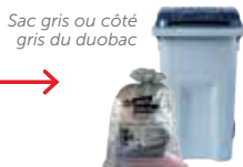
Sac gris ou côté gris du duobac