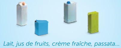
Lait, jus de fruits, crème fraîche, passata...