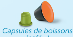
Capsules de boissons (café...)