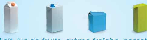
Lait, jus de fruits, crème fraîche, passata...