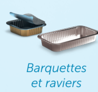
Barquettes et ravieres