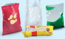
Sacs et sachets