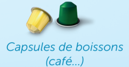
Capsules de boissons (café...)