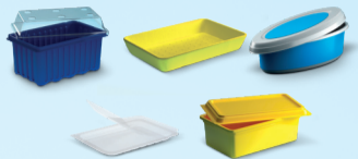
Barquettes et ravieres