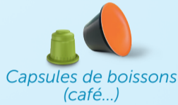
Capsules de boissons (café...)