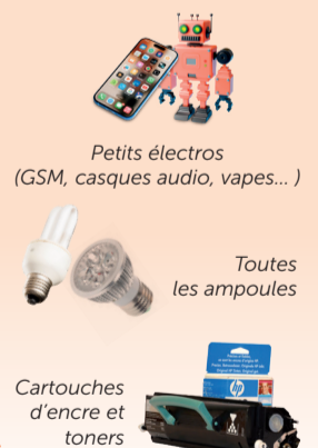
Petits électros (GSM, casques audio, vapes...)