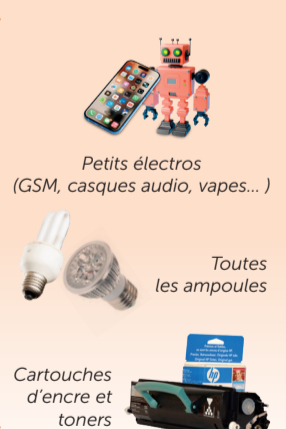
Petits électros (GSM, casques audio, vapes...)