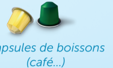
Capsules de boissons (café...)