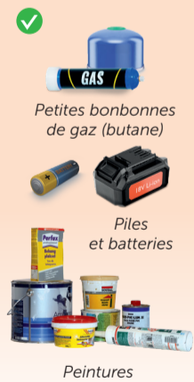
Petites bonbonnes de gaz (butane)