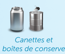
Canettes et boîtes de conserve