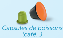
Capsules de boissons (café...)