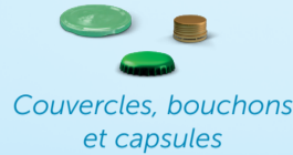
Couvercles, bouchons et capsules