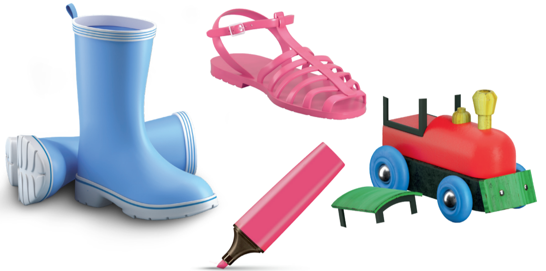
Diverse nicht recycelbare Gegenstände: Spielzeug, Kugelschreiber, Stiefel, Sandalen usw.