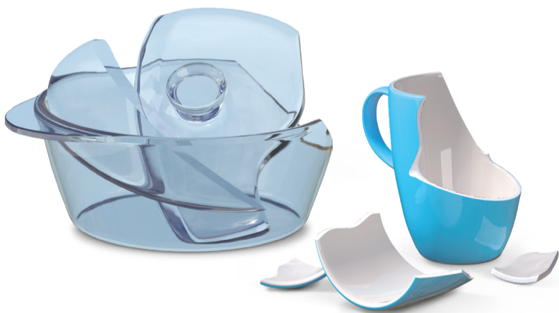
Hochtemperaturbeständiges Glas (Auflaufformen), kaputtes Geschirr

Container für nicht recycelbare und nicht gefährliche Abfälle