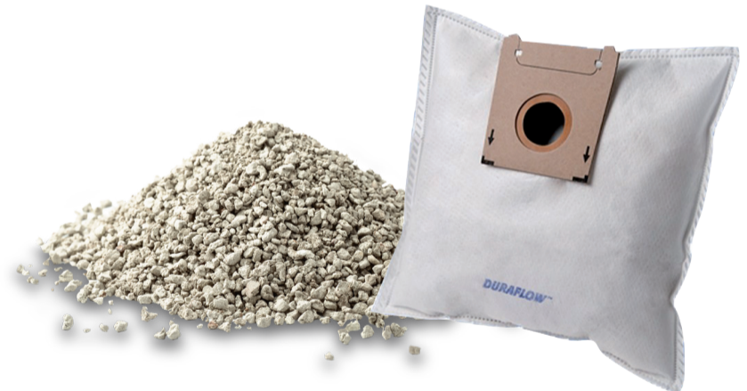
Staub, Staubsaugerbeutel, kalte Asche, nicht biologisch abbaubares Tierstreu usw.